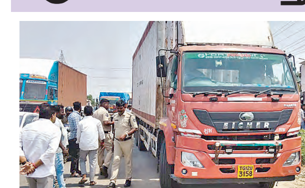
పశువులతో రవాణా చేస్తున్న వాహనాన్ని పోలీస్ స్టేషన్ కు తరలిస్తున్న పోలీసులు

మేడ్చల్, మే 21, ప్రభాతవార్త : అక్రమంగా పశువులను తరలిస్తున్న వాహనాన్ని మేడ్చల్ పట్టుకున్నారు. పోలీసులు తెలిపిన వివరాల ప్రకారం ఎల్లంపేట మున్సిపల్ వర్డిలోని డబ్బిల్ హార్డ్ గ్రామ శివారులోని 44వ జాతీయ రహదారిపై ఏర్పాటు చేసిన పోలీస్ చెక్ పోస్టు వద్ద గురువారం పోలీసులు సాదాసాదా తనిఖీలు నిర్వహిస్తున్నారు. ఈ సమయంలో నిజామాబాద్ నుండి నగరానికి వెళుతున్న డిసినీ వాహనంపై అనుమానం వచ్చి ఆ పాటా అయిదే 35 ఎమ్మెల్యు ఉన్నట్లు గుర్తించారు. నిబంధనలకు విరుద్ధంగా ఇరుకుగా వాటిని తరలిస్తున్నారు. ఆ వాహనాన్ని స్వాధీనం చేసుకుని పశువులతో పాటు మేడ్చల్ పోలీస్ స్టేషన్ కు తరలింపారు. పశువుల రవాణా అనుమతుల వల్ల, వాటిని ఎక్కడికి తరలిస్తున్నారో అంశాలపై పోలీసులు విచారణ చేస్తున్నారు. ఈ మేరకు డ్రైవర్ ను అదుపులోకి తీసుకుని కేసు నమోదు చేసినట్లు పోలీసులు తెలిపారు.