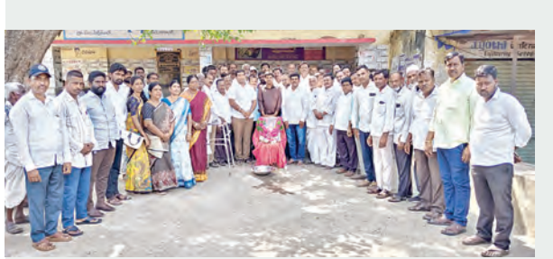
పెద్దములలో రాజీవ్ గాంధీ వర్ధంతి వేడుకల్లో పాల్గొన్న నాయకులు