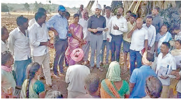
ఉపాధి పనుల కులీలతో మాట్లాడుతున్న జిల్లా కలెక్టర్ దీపక్ తివారీ

విశాఖ, మే 21, ప్రభాత వార్త: జిల్లాలో ఎండ తీవ్రత అధికంగా ఉన్నందున ఉపాధి పనుల కులీలకు జాగ్రత్తలు వహించాలని, ఉదయం 5:30 గంటల నుండి 10 గంటల లోపే తమ పనులను పూర్తి చేసుకుని ఇళ్లకు వెళ్లాలని జిల్లా కలెక్టర్ దీపక్ తివారీ సూచించారు. గురువారం విశాఖలో మండల లోని పులుమర్తి గ్రామంలో జిల్లా కలెక్టర్, ఎంపీడి. వినయ్ అధికారులు కలిసి క్షేత్ర స్థాయిలో పర్యటించారు. ఈ సందర్భంగా అక్కడ జరుగుతున్న ఉపాధి పనుల పనులను పరిశీలిస్తే, కులీలతో నేరుగా మాట్లాడారు. ఎండ దెబ్బ తగలకుండా తగిన జాగ్రత్తలు తీసుకోవాలని వారికి అవగాహన కల్పించారు. అదేవిధంగా, గ్రామంలో జాబ్ కార్డులు లేని వారికి కూడా వెంటనే ఉపాధి కల్పించేలా తగిన చర్యలు తీసుకోవాలని, అర్హతైన ప్రతి ఒక్కరికీ పని కల్పించాలని సంబంధిత అధికారులను, సిబ్బందిని కలెక్టర్ అడిగిచేశారు.