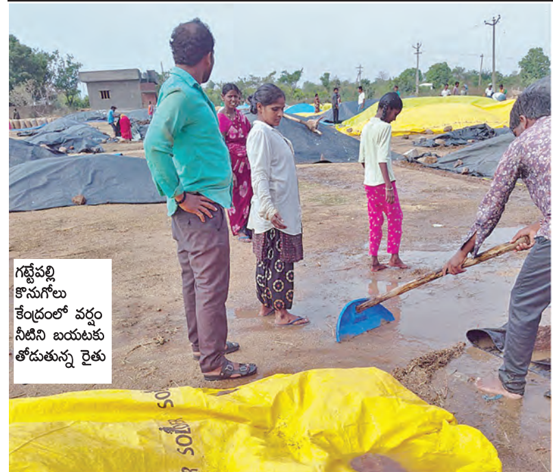
గట్టెపల్లి కొనుగోలు కేంద్రంలో పద్దం నీటిని బయటకు తోడుతున్న రైతు