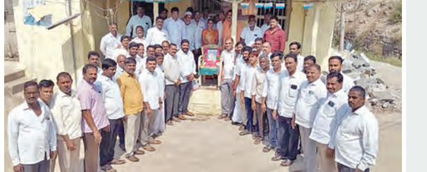
రాజీవ్ గాంధీ చిత్ర పటాన్ని పూలమాలలు వేసి నివాళులర్పిస్తున్న కాంగ్రెస్ నాయకులు